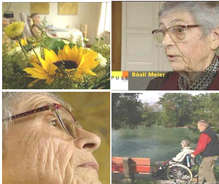
Bilder aus der Sendung "Puls" des SF 1 vom 9. Oktober 2006

Das Hospiz an der Reuss ist ein Ort menschlicher Begegnung und Zuwendung. Der Sterbende soll Ruhe und Gelegenheit finden, sich – vielleicht zusammen mit seinen Angehörigen und Freunden – mit seinem Leben, seinem Schicksal und seinem Tod auseinander zu setzen und wenn möglich zu versöhnen.