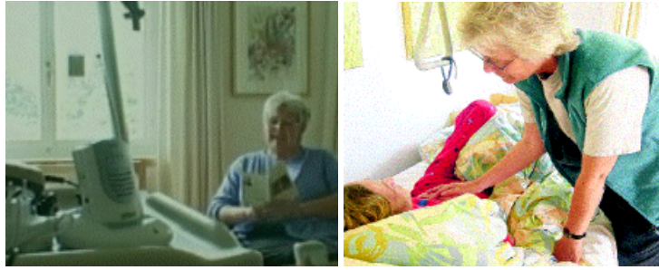
Patienten im Hopiz, liebevoll umsorgt

Das Wort „palliativ“ kommt aus dem Lateinischen und bedeutet umhüllend, umfassend, schützend (pallium: der Mantel, die Decke). Im Mittelpunkt dieser umfassenden Betreuung und Pflege stehen der Patient und seine Angehörigen.